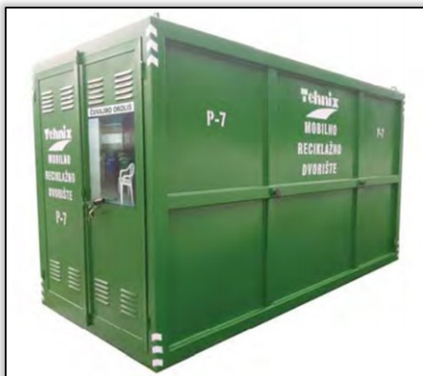
Slika 2. Mobilno reciklažno dvorište P-7 (Tehnix d.o.o)