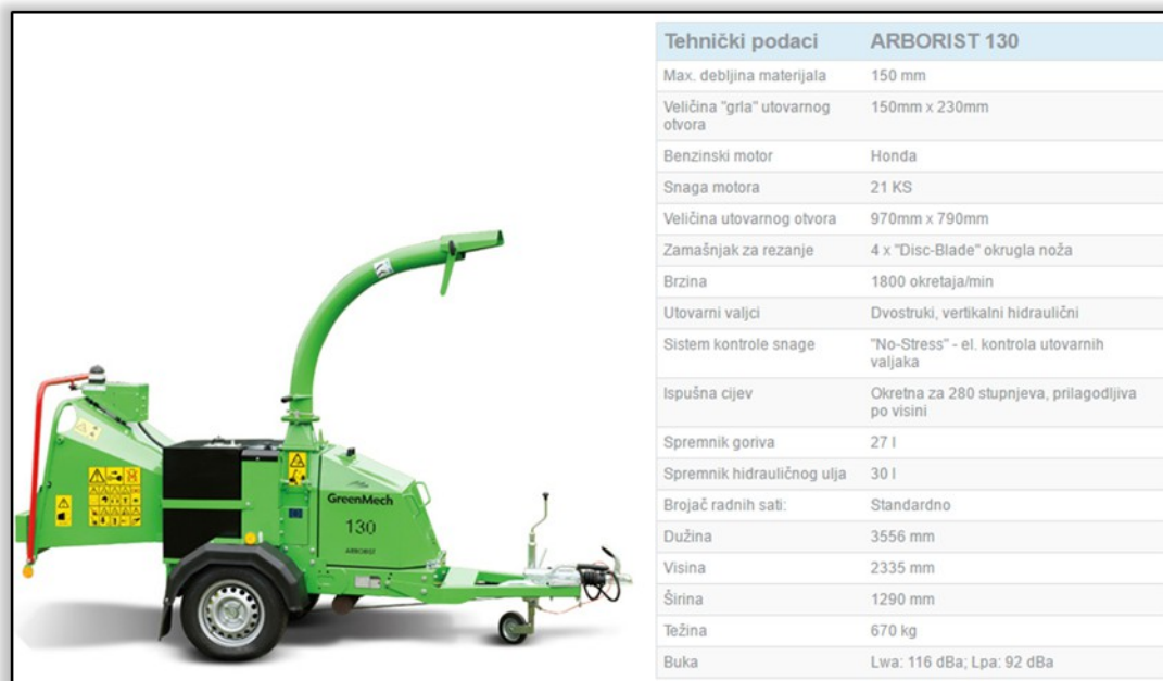
Slika 1. Sjekač drvene mase GreenMech Arborist 130 (MAGUS STROJ d.o.o.)

Sjekač drvene mase nabavljen je po cijeni od 108.200,00 kn (bez PDV-a) uz sufinanciranje Fonda za zaštitu okoliša i energetska učinkovitost u iznosu od 40%, odnosno 43.280,00 kn. Sjekač drvene mase (GreenMech Arborist 130) osigurala je tvrtka MAGUS STROJ d.o.o.